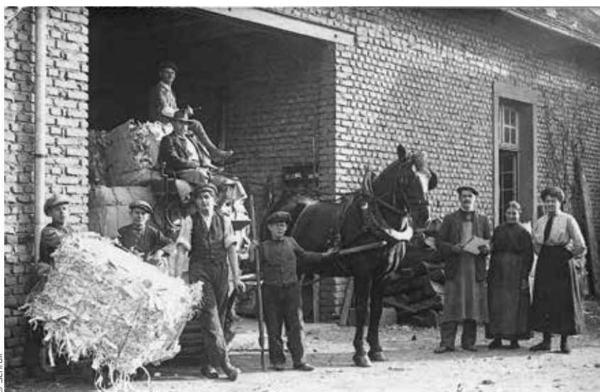
^ L'aventure a débuté par le ramassage de déchets à cheval, au tournant des XIX e et XX e s.

mandes – depuis les temps héroïques de 1892 où Louis Fernand Schroll commença à sillonner la région, à cheval, en quête de papiers et cartons usagés des relieurs et imprimeurs afin de les livrer à une fabrique de cartons allemande (l'Alsace appartenait alors au Reich).